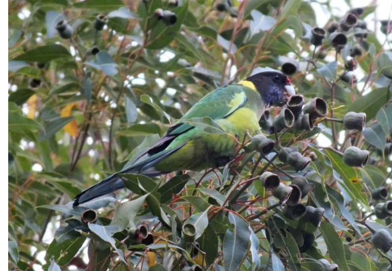
LB: Gracetown Caravan Park. RB: Twenty-eight parrot, Barnardius zonarius semitorquatus . LO: Red wattlebird, Anthochaera carunculata woodwardi . MR: Pizzaverkoop op de camping.

Om 15:30 komen we bij Gracetown op de camping aan. Op dit heel grote Gracetown Caravan Park overnachten we vandaag. 's Avonds gaan we pizza's halen bij een pizzacaravan op de camping. We moeten wel zo'n half uur in de rij staan voor die vers bereide en op houtvuur gebakken pizza's. Prima dus.