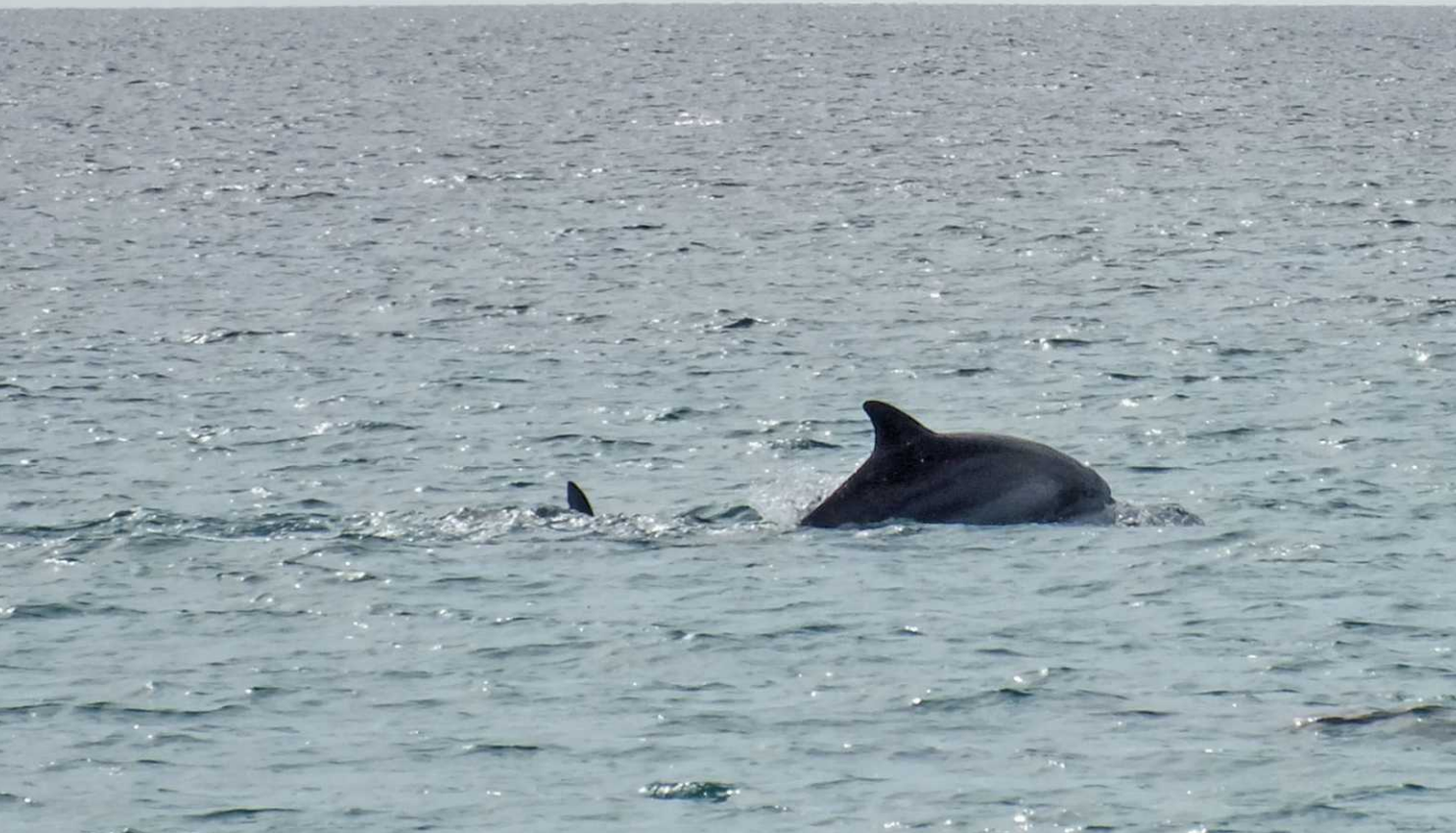
Deze pagina: Bottlenose dolphin, Tursiops truncatus.

Ze blijven langere tijd goed in zicht en zijn zich zo te zien aardig aan het vermaken.