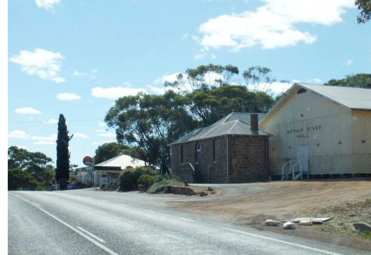
Deze pagina: Het plaatsje Arthur River.

Een kwartier later pauzeren we aan de Arthur River. Dat is een oude pleisterplaats, die vandaag gesloten is vanwege Anzac Day. Op de 25e april wordt de geallieerde aanval op Gallipoli (Turkije, 1915) herdacht. Die aanval was hopeloos verkeerd ingeschat. Na 9 maanden werd besloten terug te trekken. 11000 van de 16000 Australiërs werden gedood en 86000 Turken.