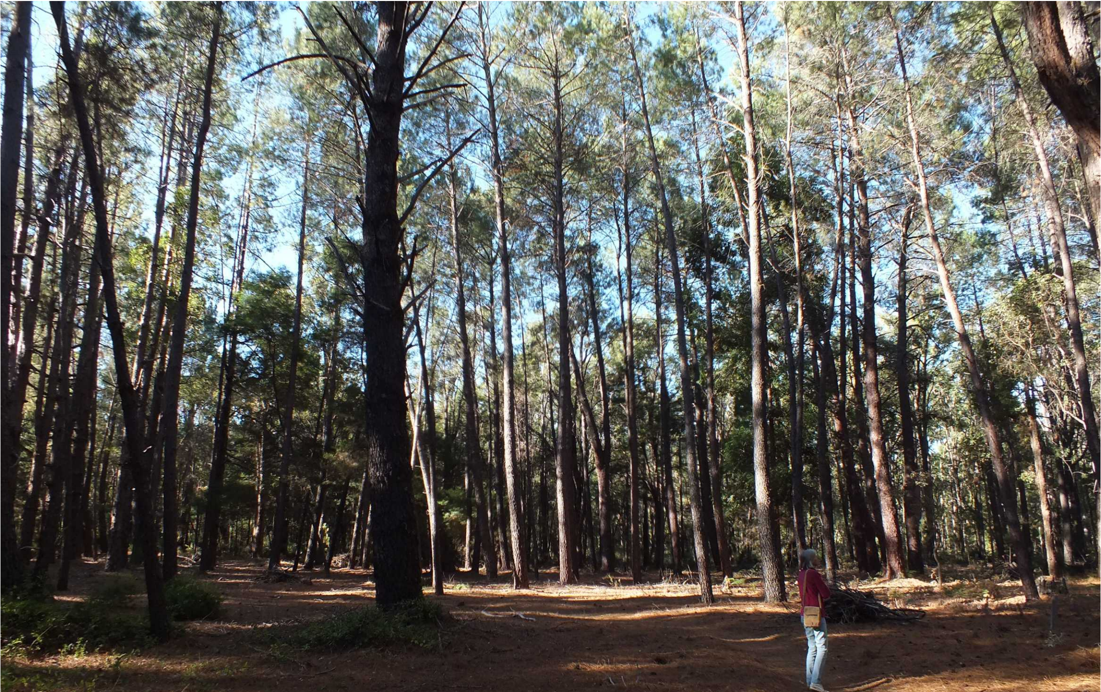
Kendenup - Arthur River - Inglehope - Dwellingup.