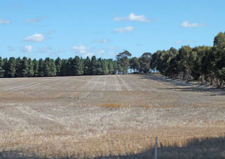
Beaufort River steken we om 11:47 over.