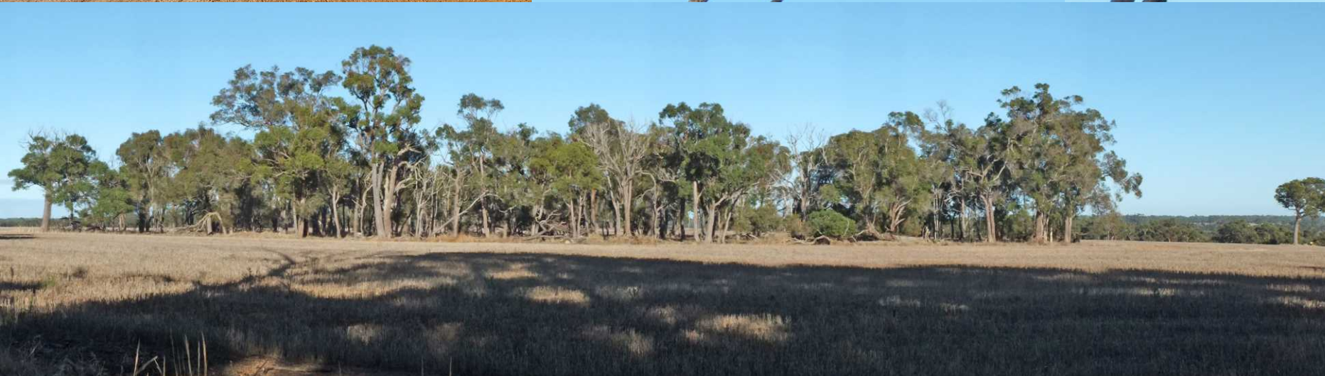
25-04-2017. Kenderup – - Arthur River – Inglehope – - Dwellingup. 's Morgens zien we Twenty-eight parrots, Galah's Scarlet robins en Red-capped parrots. LB: Kenderup Campground. MB: Red-capped parrot, Purpureicephalus spurius . RB: Twenty-eight parrot Barnadius zonarius semitorquata . O: Scarlet robin, Petroica multicolor .