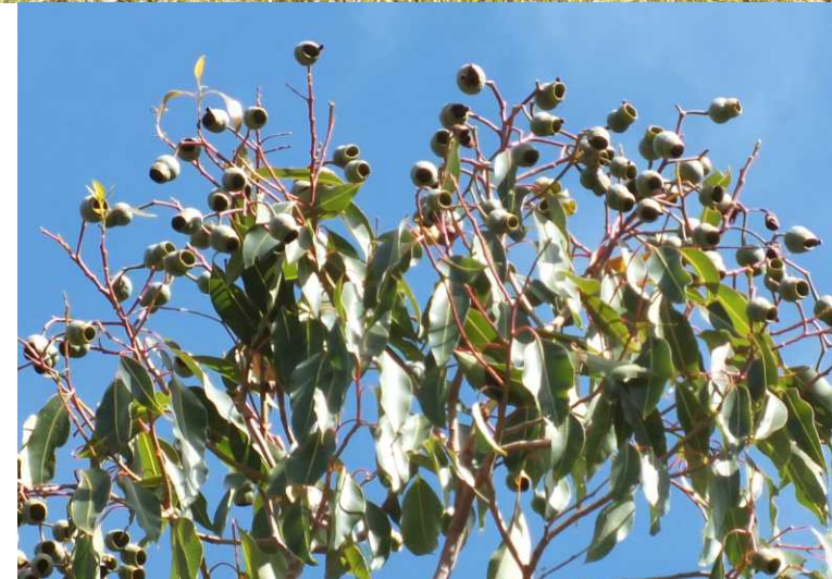
LB, RO: Eucalyptus sp. RB: Serpentine River .

Op zich een aardig pad zolang men niet naar rechts kijkt. Daar ligt een afschuwelijk lelijke en dikke pijpleiding. Op gegeven moment dalen we een stuk af in de richting van de rivier, zodat we die nog even wel zien. Eerder werd hij door bomen en struiken uit het zicht gehouden. We vinden het best en draaien dus weer om.