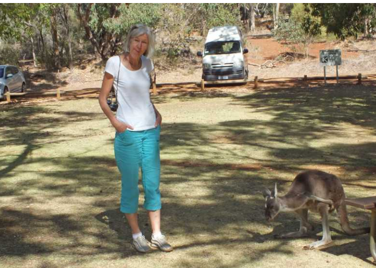
LB, RB, MO: Western grey kangaroo, Macropus fuliginosus .

Ondanks dat er overal verboden is om dieren te voeren, wordt dat dus wel gedaan en komen ze dan ook schooien. Leuk is natuurlijk wel dat er eentje een Joey in de buidel heeft.